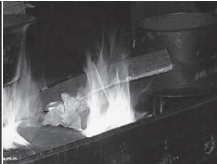
An einem zünftigen Feuer wird auch zünftig gebruzzelt - hier bei der Freyen Ritterschaft Odenwald zu Reichelsheim im Jahre 2008.

der Walpurgiskapelle bei Fürth-Weschnitz, der Kreidacher Höhe, in Mörlenbach auf der Klein-Breitenbacher Höhe und in Vöckelsbach sowie auf der Greiner Höhe bei Hirschhorn.