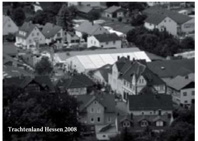
Trachtenland Hessen 2008

Alle Berichte und Bilder sind auch unter www.hvt-hessen.de zu finden.