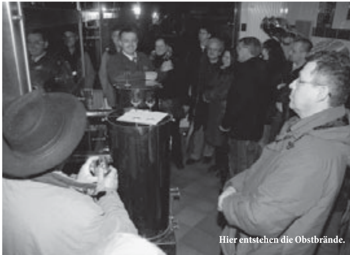
Hier entstehen die Obstbrände.