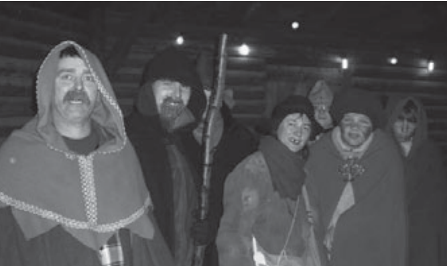
Die Mitglieder der berühmten Hölzerlipsbande alias des Odenwälder Kleinkunstvereins DoGuggschde.