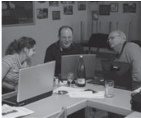
MUSIKBEARBEITUNG AM PC

von Hans-Joachim Kuhn hans-joachim.kuhn@hvt-hessen.de