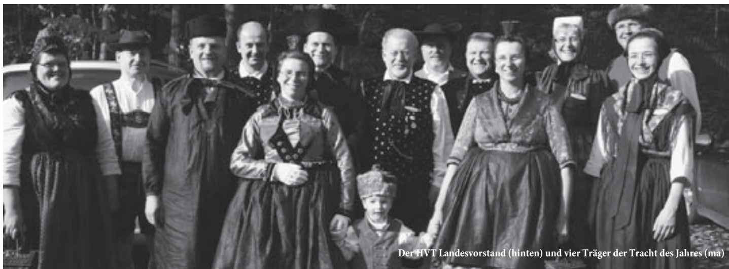
Der HVT Landesvorstand (hinten) und vier Träger der Tracht des Jahres (ma)