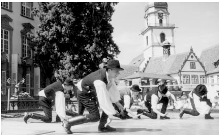
Ungarn aus Darnozseli

Die Gäste aus Laggenbeck, Westfalen, zeigten, dass man auch mit klobigen Holzschuhen das Tanzbein schwin-