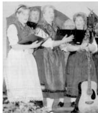
Der Singkreis Abtsroda trug mit seinen Liedern zu dem schönen Abend bei

Nach einem Auftritt der Singgruppe des Trachtenvereins Abtsroda und der Stubenmusik Kleinsassen, die auf zwei Hackbrettern und vier weiteren Saiteninstrumenten ihr Können mit fröhlichen