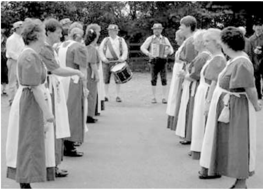
Die Heartseases bei ihrem Auftritt vor einem Pub