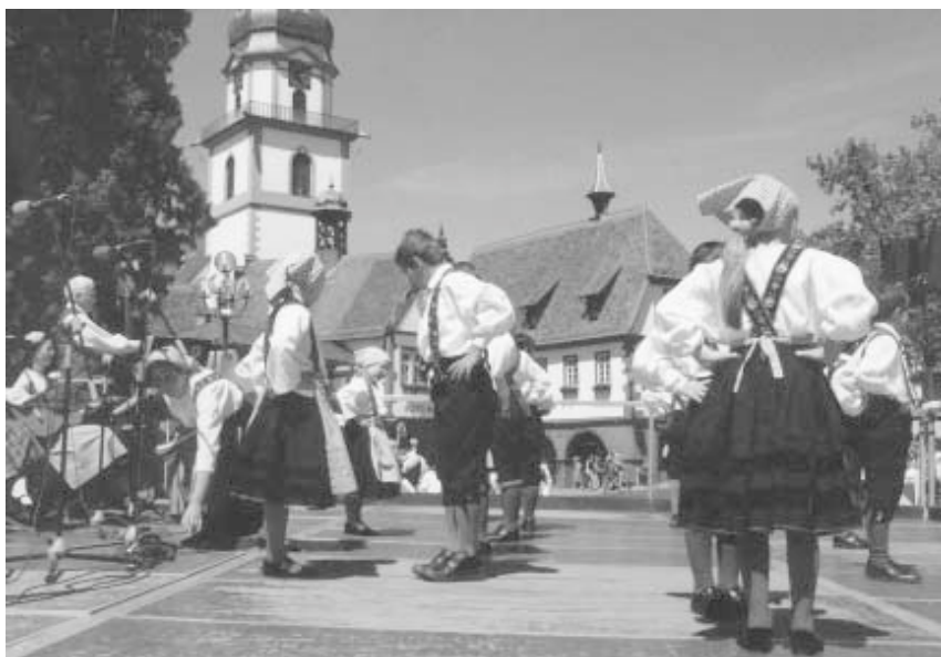
Unsere Kleinsten .... Hans-von-der-Au-Gruppe

Vom 29. 05. bis einschließlich 03. 06. 2002 hatte die Hans-von-der-Au-Gruppe aus Erbach zu einem int. Trachtenfest eingeladen. Insgesamt folgten 5 Gruppen aus dem In- und Ausland dieser Einladung.