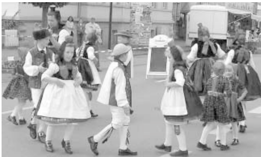
Da wir leider keine Bilder von uns haben, als wir tanzten, zeigen wir die Kindergruppe aus Röllshausen.