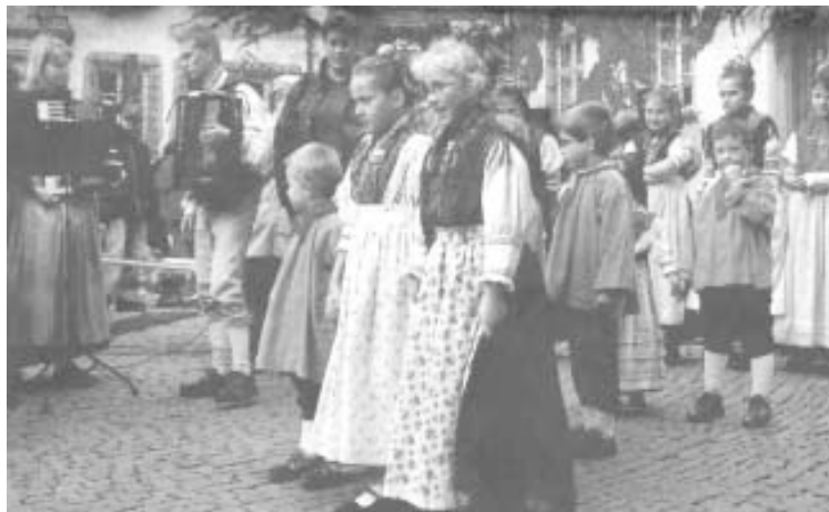
Tanz der Kinder: Das jüngste Mitglied der Ausbacher Kindertanzgruppe ist vier Jahre alt. In ihren bunten Trachten zeigten sie einige Tänze vor begeisterten Zuschauern in der Fußgängerzone.

Ebenfalls am Lullusbrunnen hatten die Schlepperfreunde Reilos vier antike Traktoren aufgefahren. Mit ihren typischen grünen oder türkisfarbenen Karosserien wurden die Schlepper von den Besuchern bestaunt und begutachtet.