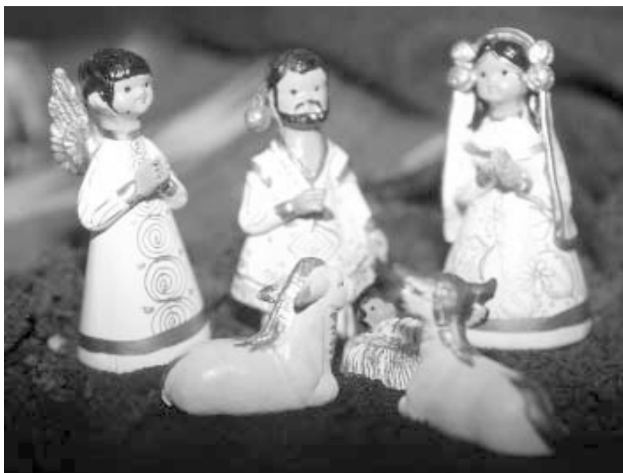
Weihnachtskrippe aus Südamerika