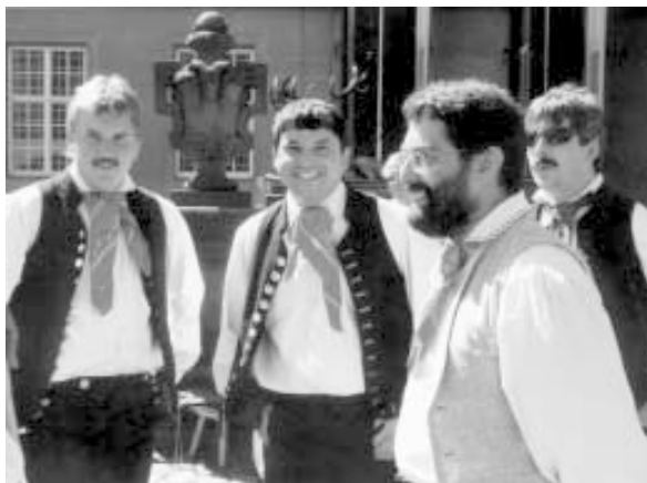
Freunde aus Jicin, die Tanzgruppe Cesky raj