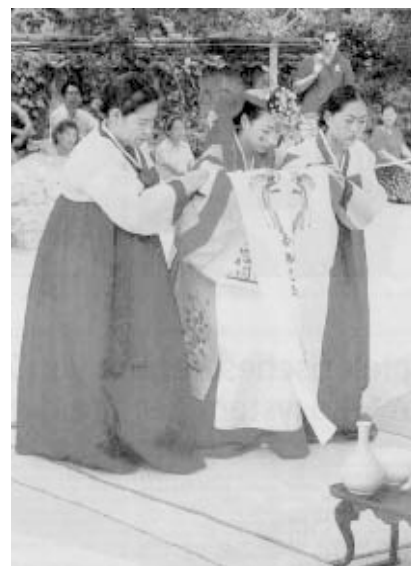
Besonders erhehend und festlich war für die Trachtentänzer jenseits des WM-Trubels das Miterleben einer koreanischen Hochzeit, die hier zelebriert wird.

Auch das, gezwungenermaßen, nötige Experiment der Musikbegleitung mit drei Trompeten und zwei Akkordeons, erwies sich als durchaus gangbar. Die Musiker