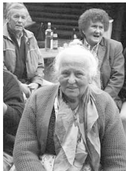
In Original Marburger Evangelischer Tracht war diese Volkskunstschaftende nach Obereisenhausen gekommen