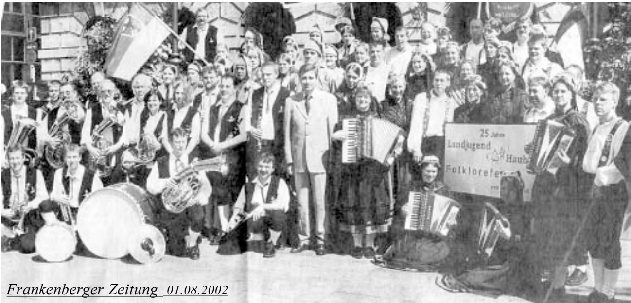
Frankenberger Zeitung 01.08.2002

Gruppenbild der heimischen Europeade-Vertreter vor dem Rathaus in Antwerpen: die Dodenauer Feuerwehrkapelle, die Geismarer Landjugend und die Haubener Jugendlichen.