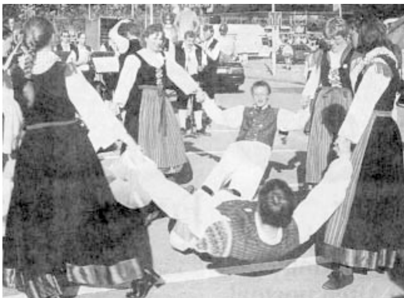
Die Geismarer Landjugend führte verschiedene Tänze auf