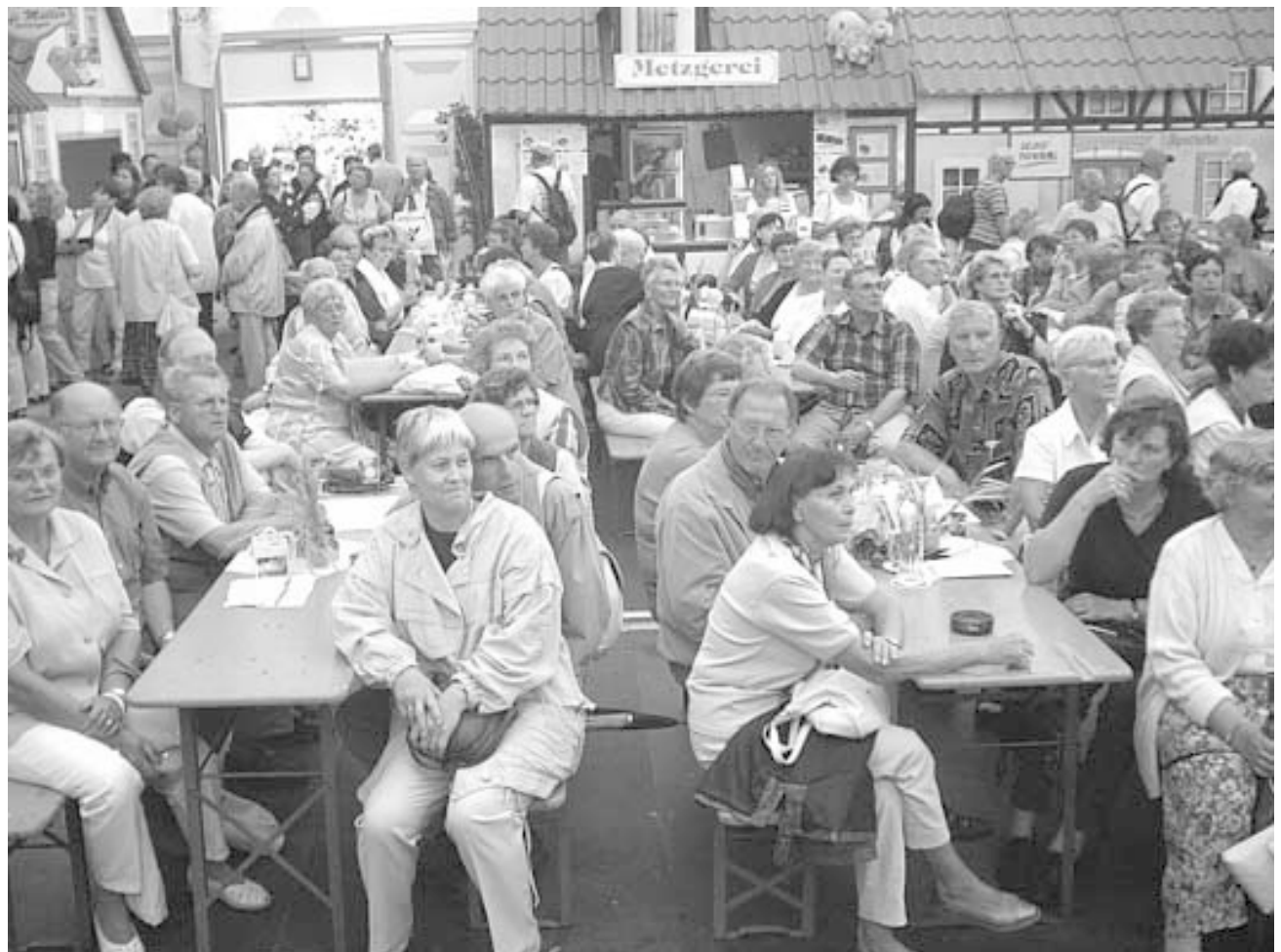
Das ist unser 'Marktplatz Hessen'