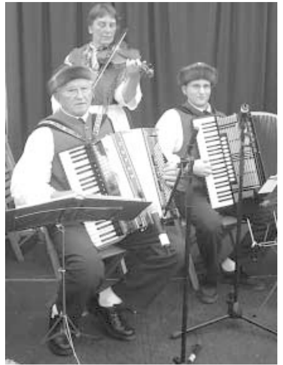
Musik der Lauterbacher Trachtengilde