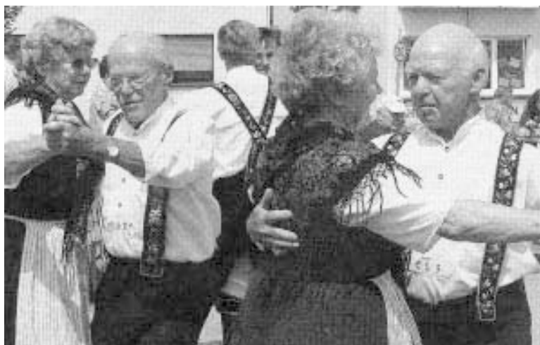
Gelungenes Backbausfest in Watzenborn-Steinberg Pohlheim (ang). Leckere Bauernbrote, »Floare«, Streusel- und Butterlochkuchen waren der »Renner« beim Backhausfest des Ortsvereins Watzenborn-Steinberg in der Heimatvereinigung Schiffenberg. In einem großen Ansturm machten sich die Gäste über die gebackenen Spezialitäten her. Einen getanzten »Watzenborner«, das Rosentor und einen lustigen Walzer zeigte die Volkstanz- und Trachtengruppe der Heimatvereinigung (Foto) im Rahmenprogramm des gelungenen Festes.

Carla Rühl Geranienweg 11 35463 Fernwald Tel.: 0641 - 46351 Fax: 0641 - 493521