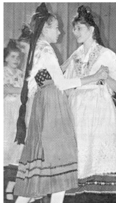
Von Kindern für Kinder: Darbietung der Jugend- und Volkstanzgruppe Salzböden am Samstagabend in der Stadthalle Staufenberg.