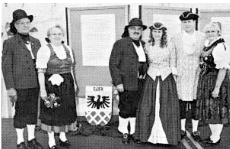
Egerländer Gmoi Gießen zu Besuch im HVT / BkJ - Kulturtreff auf Hessentag in Bad Arolsen