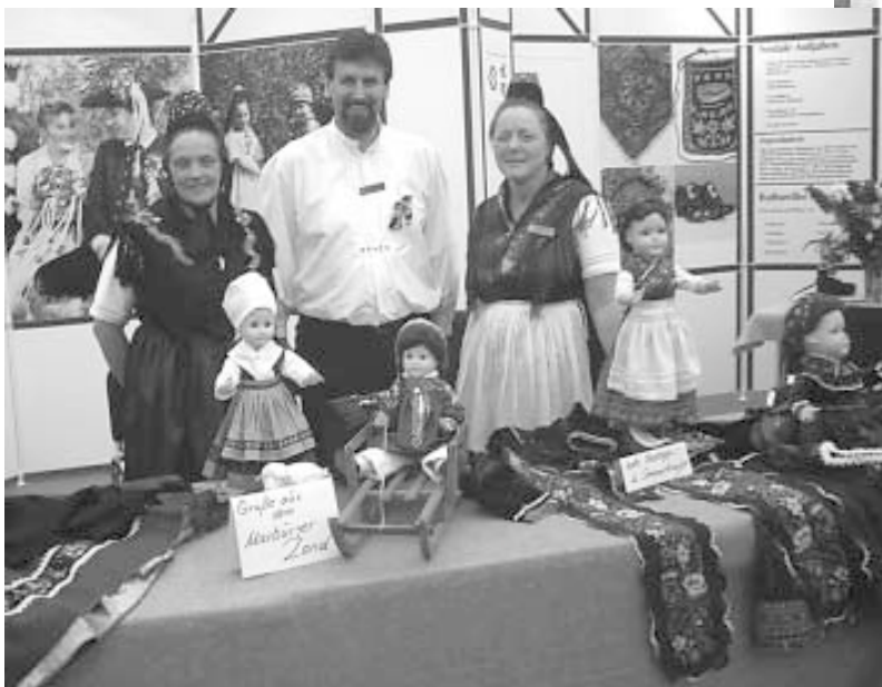
Stand in der Landesausstellung