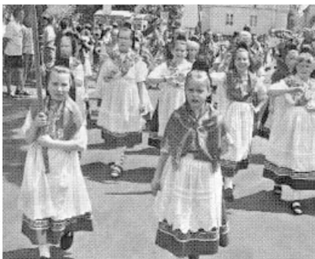
Kinder aus Rüdtingshausen beim Festzug in Geilshausen