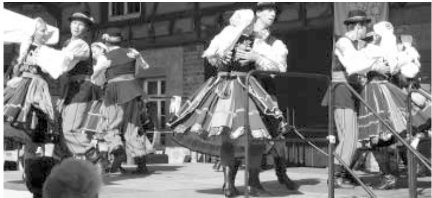
Die polnische Gruppe „Promni“ aus Warschau

Natürlich tanzte auch der Gastgeber mit seiner Jugend- und Trachtengruppe. Besonderer Höhepunkt war die Folkloreshow der polnischen Gruppe „Promni“ aus Warschau, die in ihrer Trachten die Zuschauer zu Beifallsstürmen hinriss. Trotz hochsommerlicher Temperaturen, zeigten alle Tänzer vollen Einsatz und der Spaß am Tanzen übertrug sich auch auf die zahlreichen Zuschauer