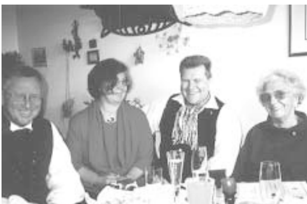
Durch ihren Beruf Die Jubilarin (rechts) erfreut sich bester Gesundheit

Das Interesse an der Marburger Tracht wurde geweckt durch ihre Tochter, die schon seit einigen Jahren in der ehemaligen Zentralgruppe, heute Volkstanz- und Brauchtumsgruppe „Die Marburger“ Mitglied war.