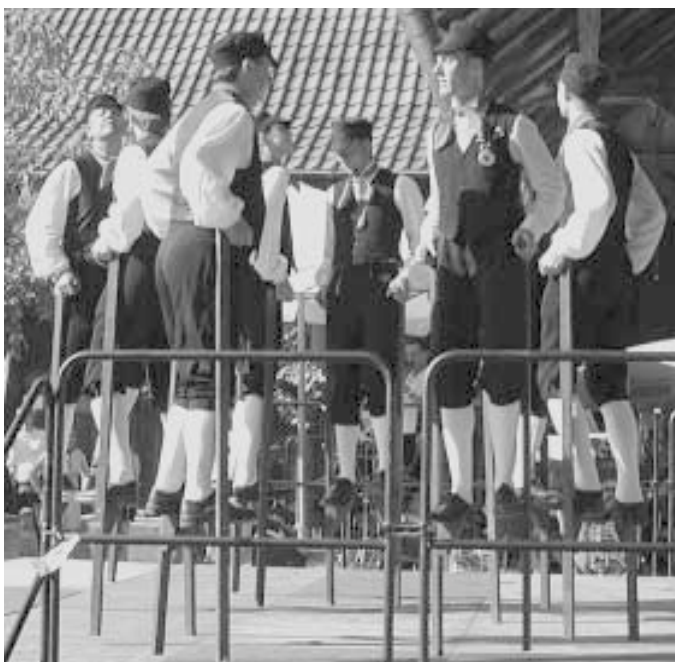
Die belgische Gruppe „Reintje Vos“