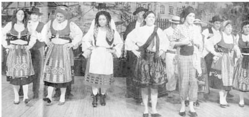
Südeuropäisches Temperament die Portugiesische Gruppe "Rancho Folklórico Missao Catolica Mainz"

Catolica“ aus Mainz. Südländisches Flair gepaart mit sportlichen Höchstleistungen riefen wahre Jubelstürme im Zelt hervor. Mit fast 50 Tänzern füllten die Volkstanzgruppe aus Leinwar und die Saarer Tanzgruppe aus Ungarn die Bühne. Die eigene Kapelle „Leanyvar Sranili“ sorgte für Stimmungsmusik. „Bis bald, auf Wiedersehen“ sangen die jungen Leute nach ihren schwungvollen Tänzen mit lauten Schlachtrufen. Die Ungarn haben ihren Aufenthalt in Haubern verlängert, sie wollen heute den Frühschoppen im Festzelt mitgestalten. Ein kleines Orchester mit Geige, Cello, Klarinette und Akkordeon begleitete die holländische Gruppe „Mie Katoen“. Tänzerisch stellten die Männer und Frauen das traditionelle Dorfleben vom Kuhmelken bis zum Wäschewaschen dar. Den „Kompentanz“ boten die Männer und Frauen aus dem holländischen Needse, die mit ihren Holzschuhen die Bühne zum Wackeln brachten. Rhythmisches Treten mit Holzschuhen zeichnete auch ⇒