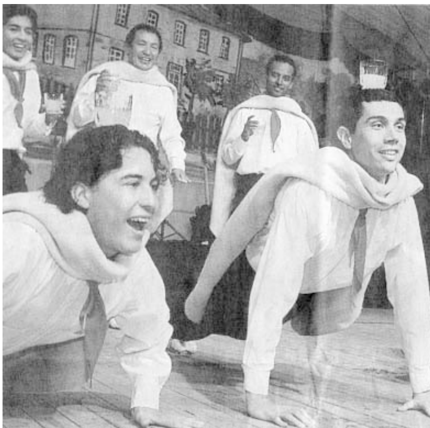
Tanz und Akrobatik: Die Folkloregruppe "Carmen Lopez" war der heimliche Star.

Das vierstündige Programm wurde dem Motto „Ein Streifzug durch die Welt der Folklore“ voll gerecht. Die Gruppen rissen die Besucher nicht nur mit ihren artistischen Tänzen von den Bänken, sondern begeisterten auch mit Schauspielerei, Gesang und Live-Musik - allen voran die heimlichen Stars des Folklorefestes: die „Grupo de Danzas Folcloricas Carmen Lopez“ aus Kolumbien. Sie tanzte mit Gläsern auf dem Kopf und bewies ihr südamerikanisches Temperament.