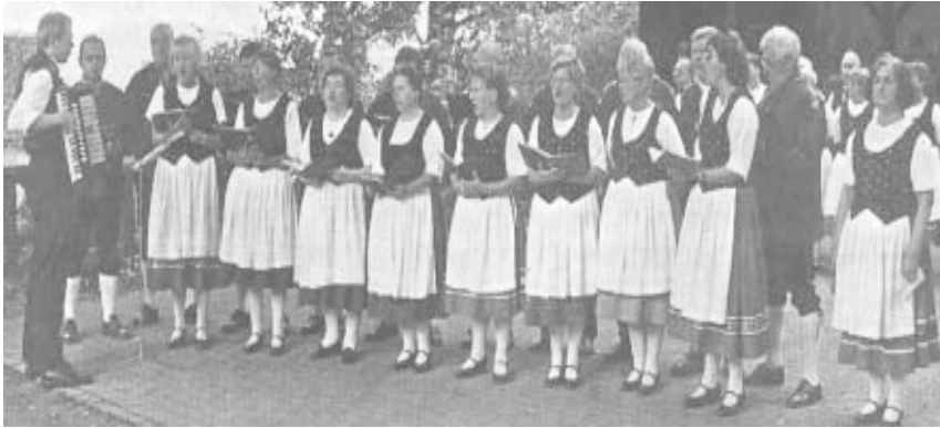
Gut bei Stimme: Die Gesangsgruppe des Volksmusikvereins