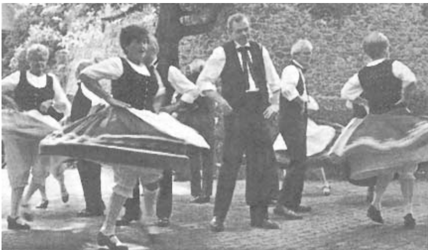
Schwungvoll präsentierte sich die Tanzgruppe